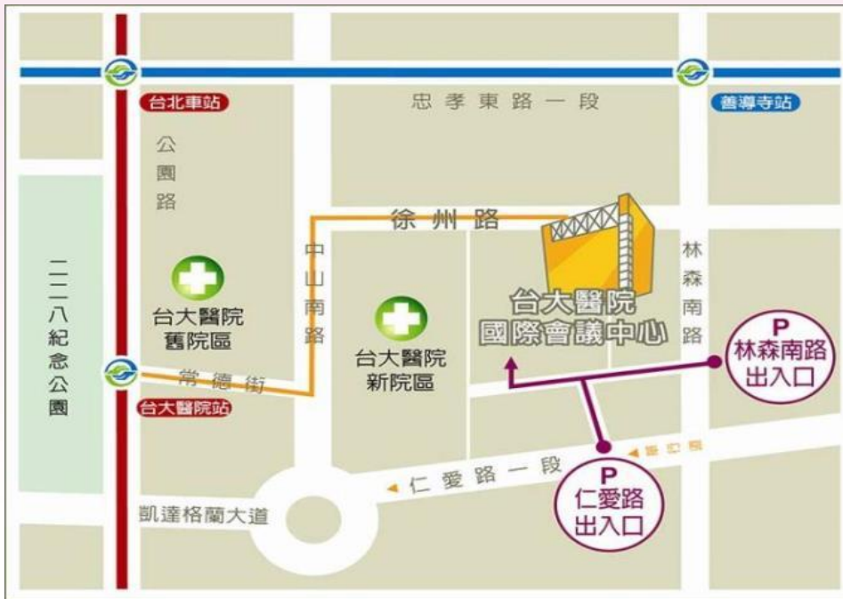
會議中心位置及停車動線圖